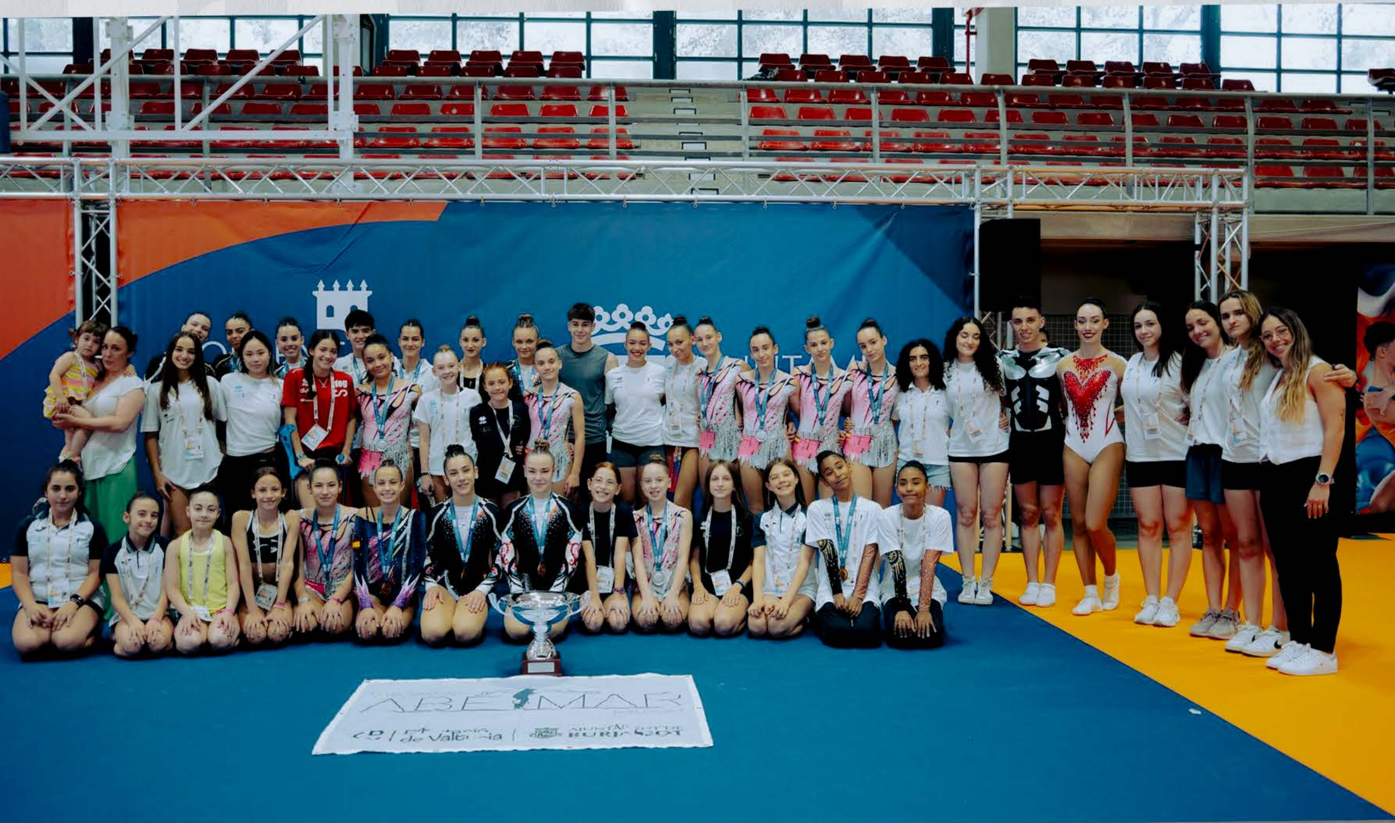
Campeonato de España AER 2024 - Subcampeones de España

Ya sea que aspire a perfeccionar tus habilidades, o que desees probar algo completamente nuevo, en Abetmar encontrarás lo que necesitas. Ofrecemos clases de gimnasia aeróbica para niñas/os de todas las edades y niveles de habilidad. Disponemos de entrenadoras de gran cualificación y dedicación que te asegurarán una vivencia divertida a la par que segura.